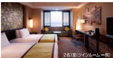
2名1室(ツインルーム 一例)