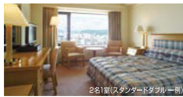
2名1室(スタンダードダブル 一例)