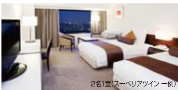
2名1室(スーベリアツイン 一例)