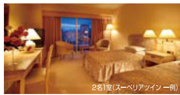
2名1室(スーベリアツイン 一例)