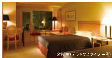
2名1室(デラックスツイン 一例)