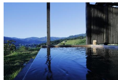
一軒貸スイート「THE HOUSE IZUMI」 露天風呂