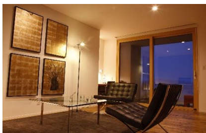
里山十帖 お部屋(一例)