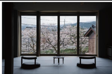
OUKA(オウカ・お部屋一例)