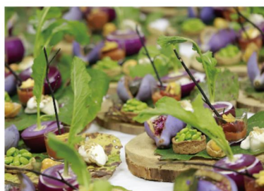
里山十帖ファームダイニング(料理イメージ)