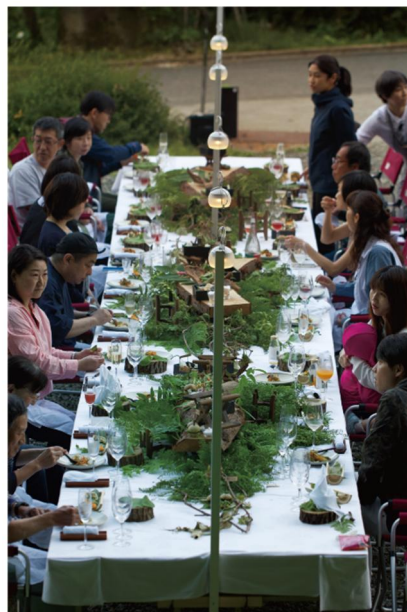
里山十帖ファームダイニング(イメージ)